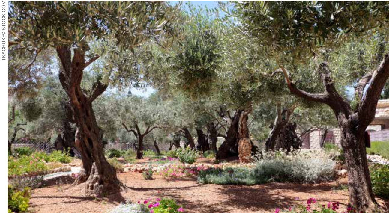
GETSÊMANI Os lírios crescem no Jardim do Getsêmani, onde, há quase 2.000 anos, Cristo orou para que se fizesse a vontade de Deus, ao enfrentar a prova mais severa que qualquer ser humano jamais sofreu.

COMENTÁRIO: Estes versículos constituem uma das passagens mais fundamentais das escrituras na Bíblia. A palavra restituição no versículo 21 (Versão King James) significa restauração . Algo que foi tirado será restaurado